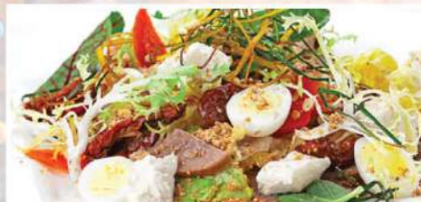
САЛАТ С ЯЗЫКОМ И ВЯЛЕНЫМИ ТОМАТАМИ 270 г 460₽ с мороженым хреном, болгарским перцем, перепелиными яйцами, европейской заправкой и ореховой посыпкой