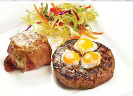
БИФШТЕК ИЗ ГОВЯДИНЫ С ПЕРЕПЕЛИНЫМИ ЯЙЦАМИ 180/150 г 580₽ Подается с запеченным луком, панчеттой и сливочно-сырным муссом