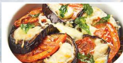
ГРАТЕН С БАРАНИНОЙ, баклажанами, томатами и сыром 300 г 590₽