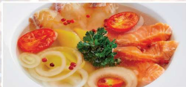
УХА АРХИЕРЕЙСКАЯ 300/50 г 560₽

подается с соленым салом, лучком, с домашней сметаной и чесночной гренкой