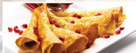
ХРУСТЯЩИЕ ТРУБОЧКИ С РУБЛЕННОЙ БАРАНИНОЙ

кольца кальмара и сырные палочки в панировке, куриные крылышки в медовом соусе, чесночные гренки и пряные хлебные чипсы с двумя видами соусов