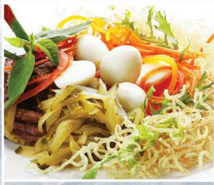
«ГНЕЗДО» 240 г 390₽ обжаренная говядина, огурец, маринованная морковь с перепелиными яйцами и хрустящим картофелем. Заправляется соусом майонез