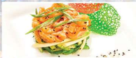
ФИЛЕ НОРВЕЖСКОГО ЛОСОСЯ, томаты, свежий огурец, зеленый лук с восточной заправкой и золотистым кунжутом

210 г 390₽ сыр пармезан, перепелиное яйцо, томаты черри, лист салата, соус горчично-сливочный