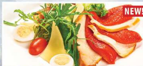
САЛАТ С КОПЧЕНОЙ КУРИЦЕЙ И ПЕЧЕНЫМ ПИКАНТНЫМ ПЕРЦЕМ NEW!

210 г 390₽ сыр пармезан, перепелиное яйцо, томаты черри, лист салата, соус горчично-сливочный