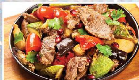
СКОВОРОДА С БАРАНИНОЙ 300 г 590₽ 1000 г 1550₽