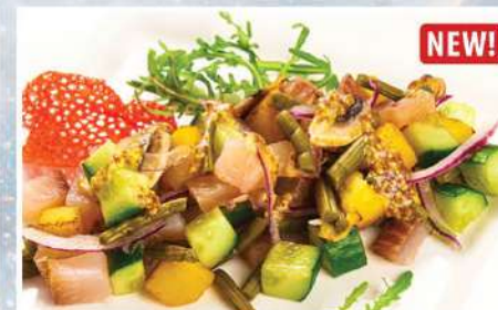
САЛАТ С КОПЧЕНЫМ МУКСУНОМ И ПАПОРТНИКОМ 240 г 460₽ NEW! огурцы свежие, шампиньоны, картофель, лук, лимонный соус с горчицей

обжаренный кальмар, золотистые шампиньоны и вешенки, свежие овощи, с зеленым миксом под имбирной заправкой