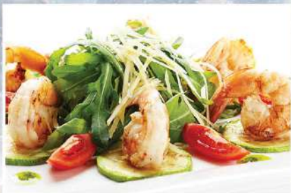
САЛАТ С ТИГРОВЫМИ КРЕВЕТКАМИ, листьями рукколы, томатами черри и цукини. с сыром пармезан и соусом песто 230 г 590₽