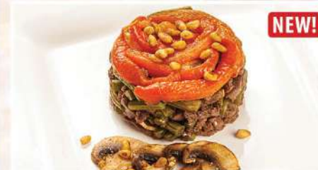
САЛАТ «ТАЙГА» 215/2 г 390₽ NEW! говядина, папоротник, шампиньоны, орех кедровый, печеный перец, оливковый соус