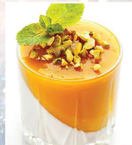
МАНГОВАЯ ПАННА-КОТТА с фисташками 250 г 280₽