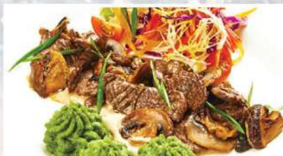
БЕФСТРОГАНОВ ИЗ ТЕЛЯТИНЫ с грибами и картофельно-шпинатным пюре 170/150/50 г 520₽