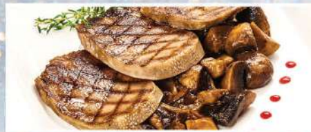
ЯЗЫК НА ГРИЛЕ