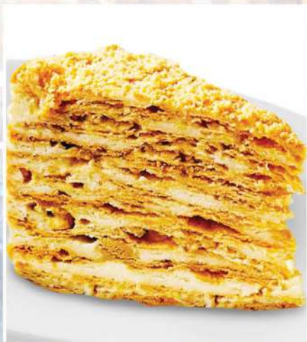
ТОРТ НАПОЛЕОН 150/2 г 210₽