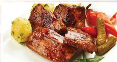
ТОМЛЕННЫЕ СВИНЫЕ РЕБРА с отварным картофелем, маринованным огурчиком и перцем «пепперони» 280/120/30/30 г 580₽