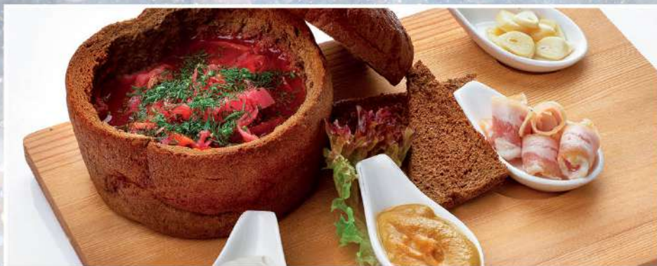
БОРЩ «БОЯРСКИЙ» 350/30/20/20 г 420₽

подается с соленым салом, лучком, с домашней сметаной и чесночной гренкой