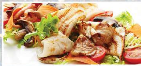
«ТОПАЗ» 290 г 420₽

обжаренный кальмар, золотистые шампиньоны и вешенки, свежие овощи, с зеленым миксом под имбирной заправкой