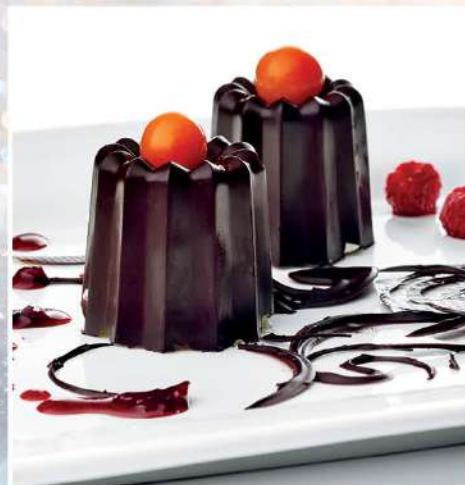
ХОЛОДНЫЙ СИЦИЛИЙСКИЙ ДЕСЕРТ 100/30/20 г 285₽