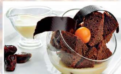
ФИНИКОВЫЙ ДЕСЕРТ с карамелью и ванильным соусом 180/30 г 230₽