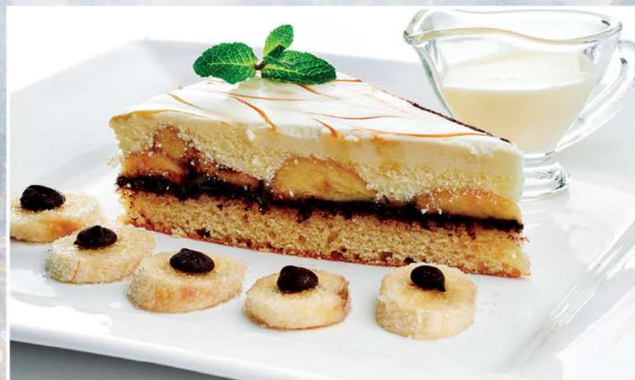
БАНАНОВОЕ СУФЛЕ с ванильным соусом 150/40/30 г 210₽