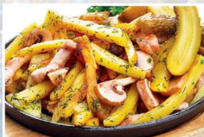
СКОВОРОДА СО СВИНИНОЙ 300 г 480₽ 1000 г 1350₽