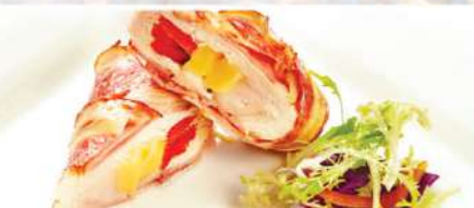
КУРИНЫЙ РУЛТИК В БЕКОНЕ с брынзой и паприкой 150/30 г 390₽