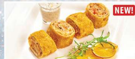
РУЛЕТИК ИЗ ЛАВАША С СЕМГОЙ И СЫРОМ МОЦАРЕЛЛА NEW!