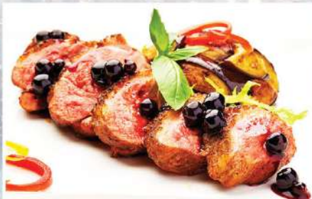
УТИНАЯ ГРУДКА С БАКЛАЖАНОМ под соусом «мисо» и черной смородиной 200/40 г 650₽