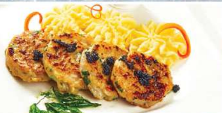
КОТЛЕТЫ ЩУЧЬИ с картофельным муссом и трюфельным соусом 150/150/40 г 460₽