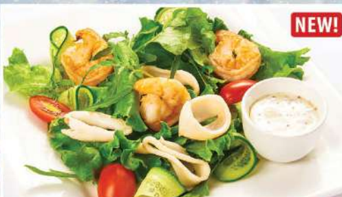
САЛАТ «ЛЕГКИЙ» С МОРЕПРОДУКТАМИ NEW! кальмары, креветки, огурцы свежие, руккола, черри, йогуртовый соус с дижонской горчицей 220/2 г 560₽