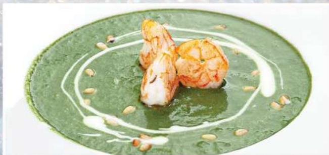
КРЕМ-СУП ИЗ ШПИНАТА 350/30 г 450₽

с морской и речной рыбкой, подается с водочкой, блинами и лучком