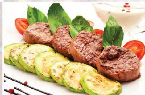
МЕДАЛЬОНЫ ИЗ ГОВЯЖЬЕЙ ВЫРЕЗКИ жареные на гриле, с чесночными цукини под сливочно-сырным соусом 100/100/50 г 590₽