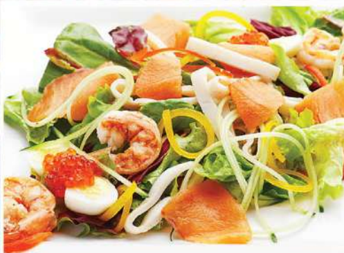
«МОРСКОЙ КОКТЕЙЛЬ» 230 г 625₽ малосольный лосось, кальмар и тигровые креветки с яйцом, хрустящей зеленью и красной икрой под оливковым соусом