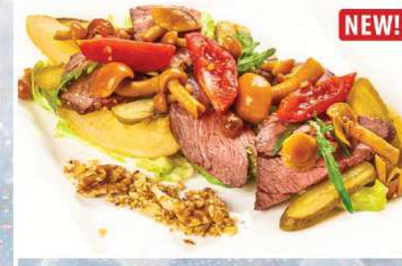
САЛАТ «ПОД ВОДОЧКУ» С РОСТБИФОМ И МАРИНАДАМИ 225 г 420₽ NEW! картофель, опята, огурцы, томаты, грецкий орех, соус горчично-сливочный