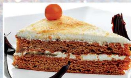
МЕДОВЫЙ ТОРТ с воздушными сливками 150 г 210₽