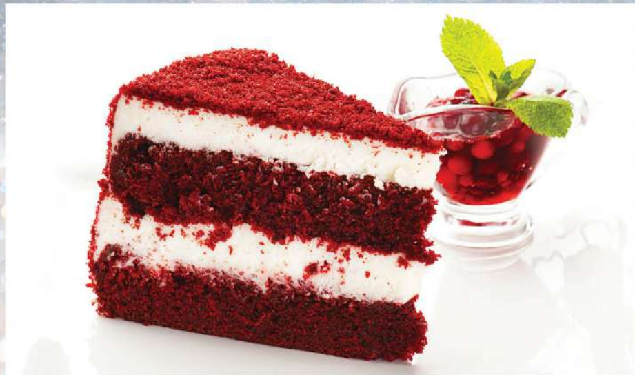
ТОРТ ШОКОЛАДНЫЙ «КРАСНЫЙ БАРХАТ» 150 г 245₽