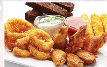
ЗАКУСКА К ПИВУ 400/80/50/50 г 660₽

кольца кальмара и сырные палочки в панировке, куриные крылышки в медовом соусе, чесночные гренки и пряные хлебные чипсы с двумя видами соусов