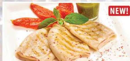
КАЛЬМАР НА ГРИЛЕ С СОУСОМ ПЕСТО И ПЕЧЕНЫМ ПЕРЦЕМ